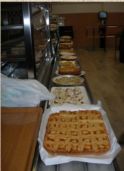
3.... a mangiare i dolci da voi preparati!