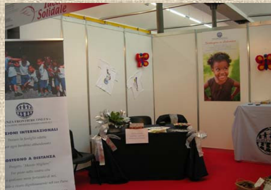
4. Lo stand di Senza Frontiere a Idea Natale