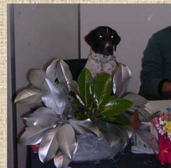
5. Servizio d'ordine