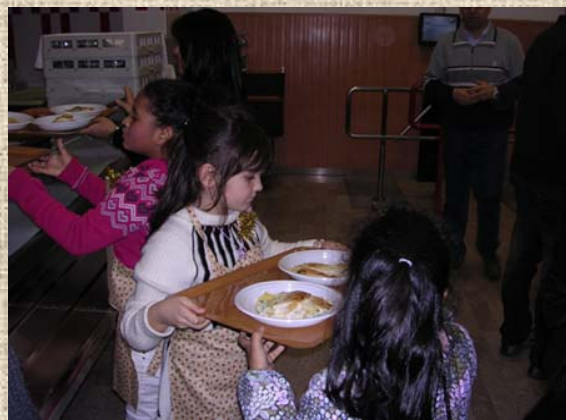
2. ....i piccoli hanno aiutato...